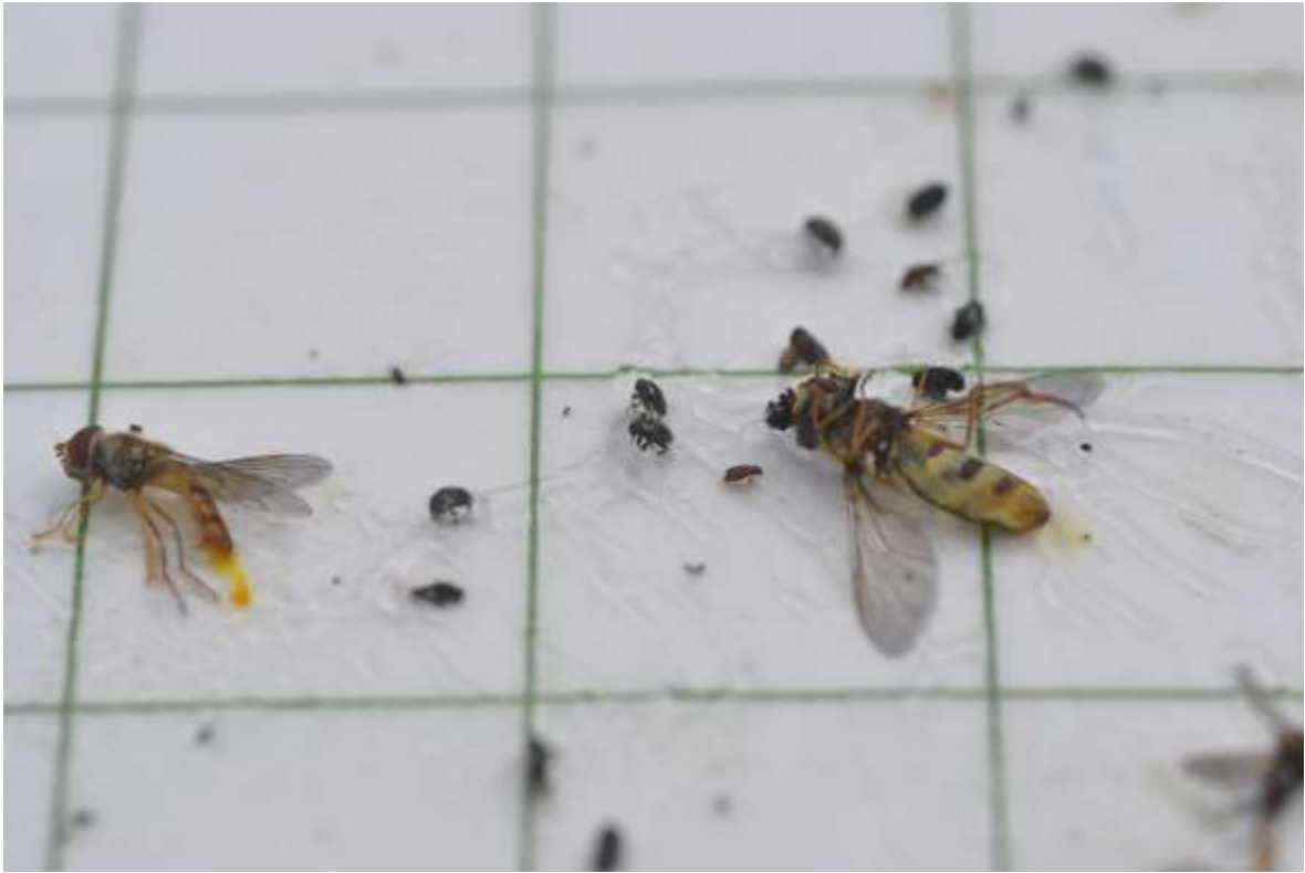
Syrphes piégés !!